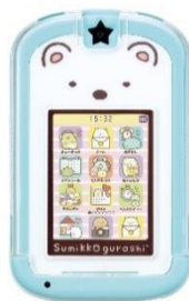
カードできせかえ！