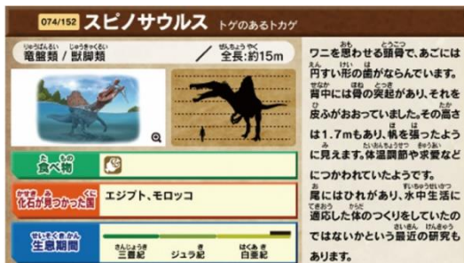
図鑑:スピノサウルス

レベルアップし強くなった恐竜を「バトル」メニューで挑戦し、勝利することで図鑑に新しい恐竜の情報が追加するなど、お子さまの意欲を引き出す仕組みも搭載しております。本商品で「たくさん遊び学ぶことで成長する」ことを体験・実感し、挑戦する力を養います。