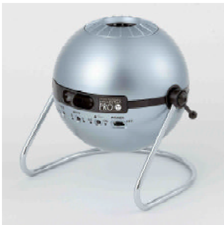
ホームスターPRO 2nd edition (シルバー/ブラック)

2009年は、ガリレオ・ガリレイが望遠鏡を使い、人類で初めて星空を眺めてから400年となる節目の「世界天文年」、また46年ぶりの皆既日食が観察できるなど天文に関する話題が集中しております。ホームスターは、天井に映し出される満天の星空を眺めてリラックスタイムをお過ごし頂くだけでなく、天文や宇宙科学への興味関心を促すサイエンストイとしてもお使い頂けます。個人でゆっくりと、恋人とロマンチックに、家族でワイワイと、いろいろなシーンでお楽しみ頂ける商品です。