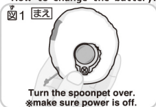
図1 ① 返す Turn the spoonpet over. ※make sure power is off.