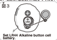
図3 ③ 入れる Set LR44 Alkaline button cell battery.