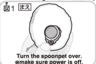
Turn the spoonpet over. smake sure power is off.