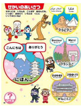
世界のいろいろなことばで、「こんにちは」「ありがとう」を学びます。