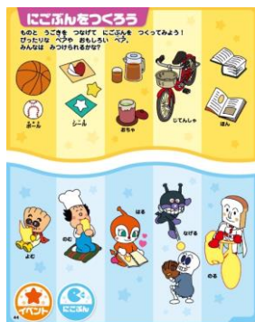
上下のことばを組み合わせ、二語文を学びます。