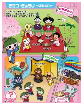
各季節の行事にまつわることばを覚えられます。