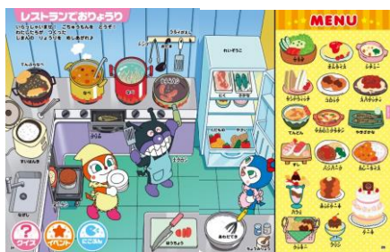
料理の道具の名前を覚えたり、料理をつくるゲームで二語文を学びます。