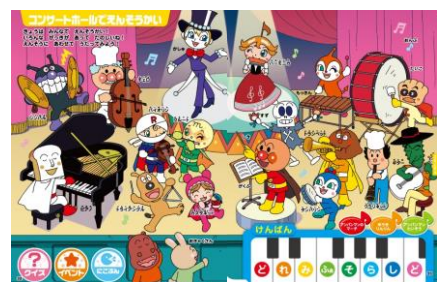
色んな楽器の名前や音を覚えることができます。鍵盤で演奏も。