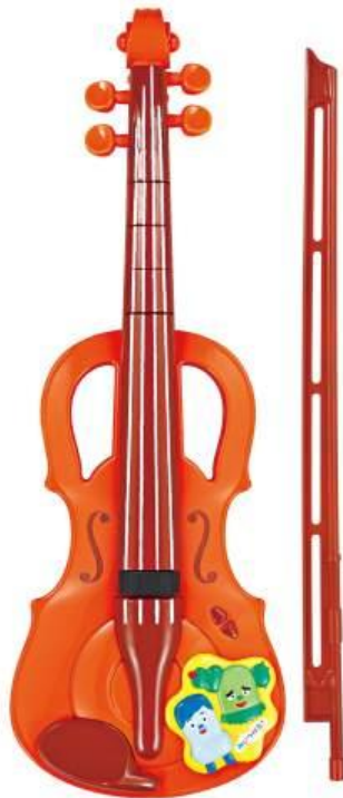
みいつけた！ コッシー & サボさんの スター☆なバイオリン