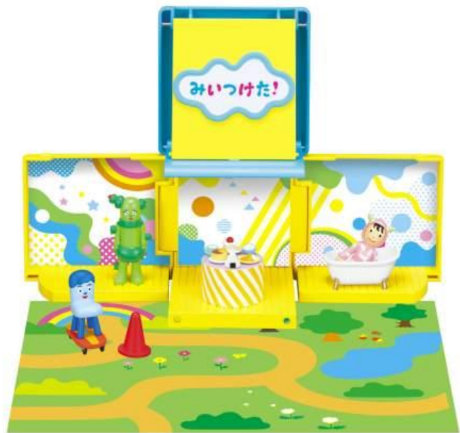
みいつけた！ ともだちみいつけた！ ハウスボックス