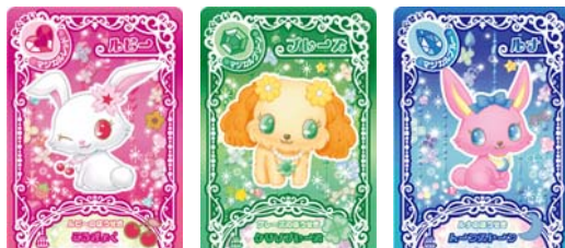
<キャラクターカード>