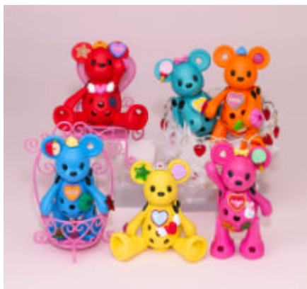
デコッチャオ」全6種

‘RIP SLYME’が6月に発売するアルバム「JOURNEY」をご購入された方の中から抽選で1000名様に‘RIP SLYME’メンバーオリジナルの「デコッチャオ」をプレゼント。その他にも、プロモーションビデオや、ポスター、スポットCMなど、‘RIP SLYME’ニューアルバムの各種プロモーションに「デコッチャオ」が登場予定。クールな‘RIP SLYME’とポップな「デコッチャオ」のコラボをお楽しみに。