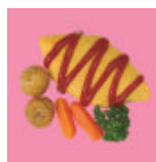
おくちモグモグパチクリメノちゃん