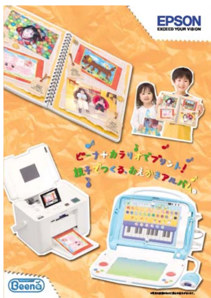
セガトイズとエプソン販売で協同制作したカタログ。イベントでの配布やセガトイズ製品と同梱されます。