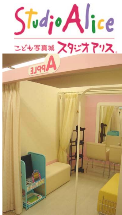
子ども写真城に設置されたビーナ実演コーナー