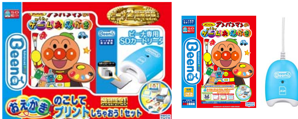
『おえかき のこして プリントしちゃおう！セット』

ソフト(「アンパンマンのわくわくゲームおえかき」)+ビーナ専用 SD カードリーダー